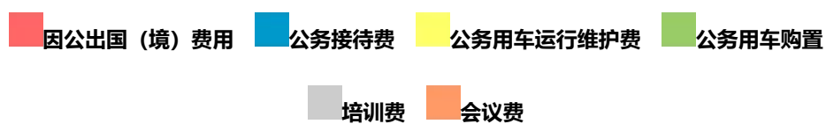
图 3、“三公”经费、培训费、会议费支出预算构成